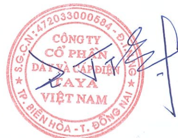
WANG TING SHU