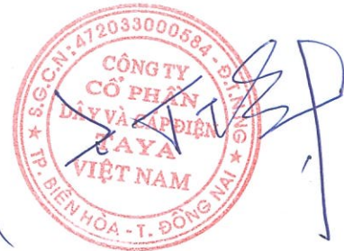
WANG TING SHU